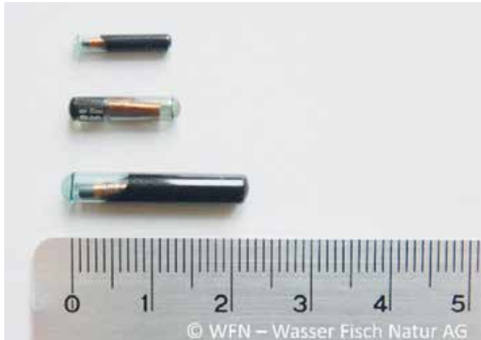
PIT-Tags in verschiedenen Grössen.

Aktuell werden im Rahmen der Wirkungskontrolle Fischlift Mühleberg im Auftrag der BKW Fische mit Mikro-Chips (PIT-Tags) markiert. Die 12 - 23 mm langen Glaskörper werden verschiedenen Fischarten in die Bauchhöhle implantiert und sehen wie folgt aus: