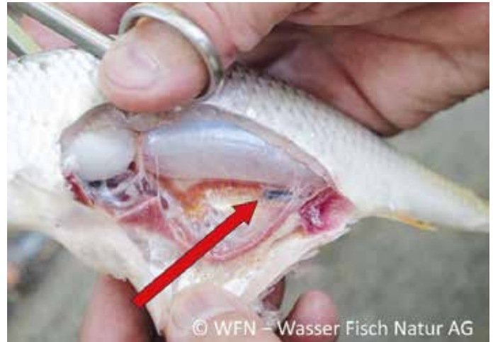
Die PIT-Tags befinden sich in der Bauchhöhle und sind oft schwer zu entdecken

Dans le cadre du contrôle de l'efficacité de l'ascenseur à poissons de Mühleberg, des micropuces (balises PIT) sont actuellement implantées dans les poissons sur mandat des FMB. Ces éléments en verre de 12 à 23 mm de long sont insérés dans la cavité abdominale de différentes espèces de poissons et ont l'aspect suivant :