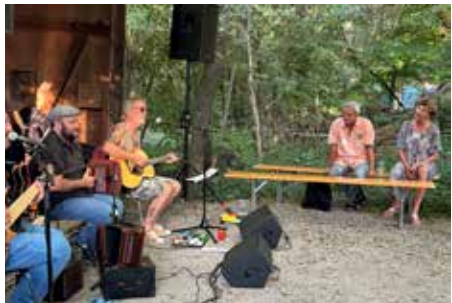
Impressionen der Jubiläums-Feier