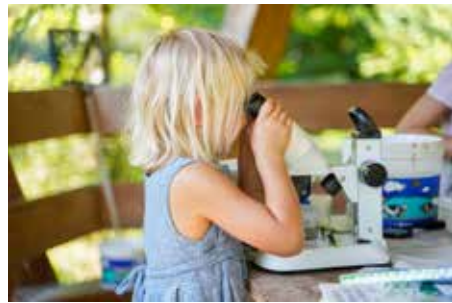
Impressions de la fête d'anniversaire