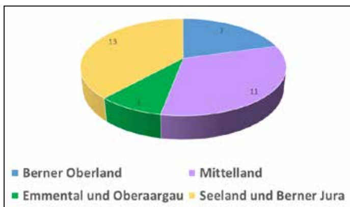
Anzahl vergebener Machbarkeitsstudien je Region. Nombre d'études de faisabilité accordées par région.

Le colloque « Revitalisation des cours d'eau dans les communes », organisé conjointement par le FRégén, Aqua Viva, l'Agenda 21 pour l'eau et l'Association suisse des professionnels de la protection des eaux (VSA), a lui aussi rencontré un accueil très positif.